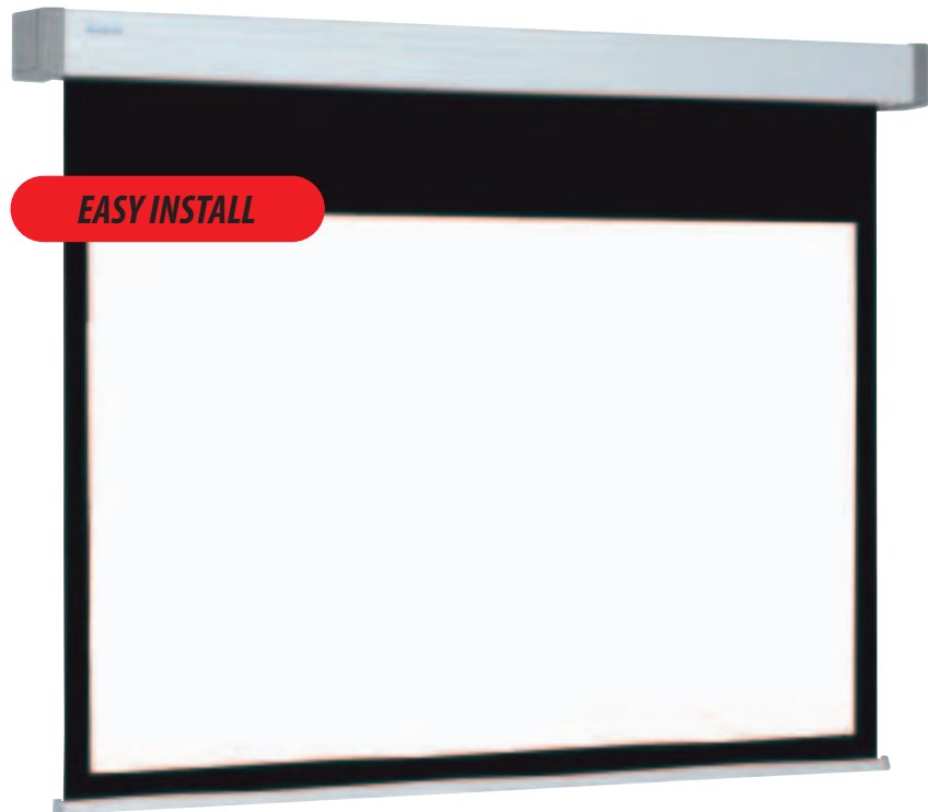
▲ Elektrisch bediente Projektionswand der Spitzenklasse mit zusätzlichem schwarzem Rand an der Oberseite für eine optimale Sichthöhe.